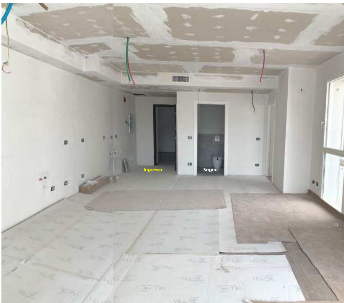
Foto n. 19. Piano Terzo. Soggiorno/cucina