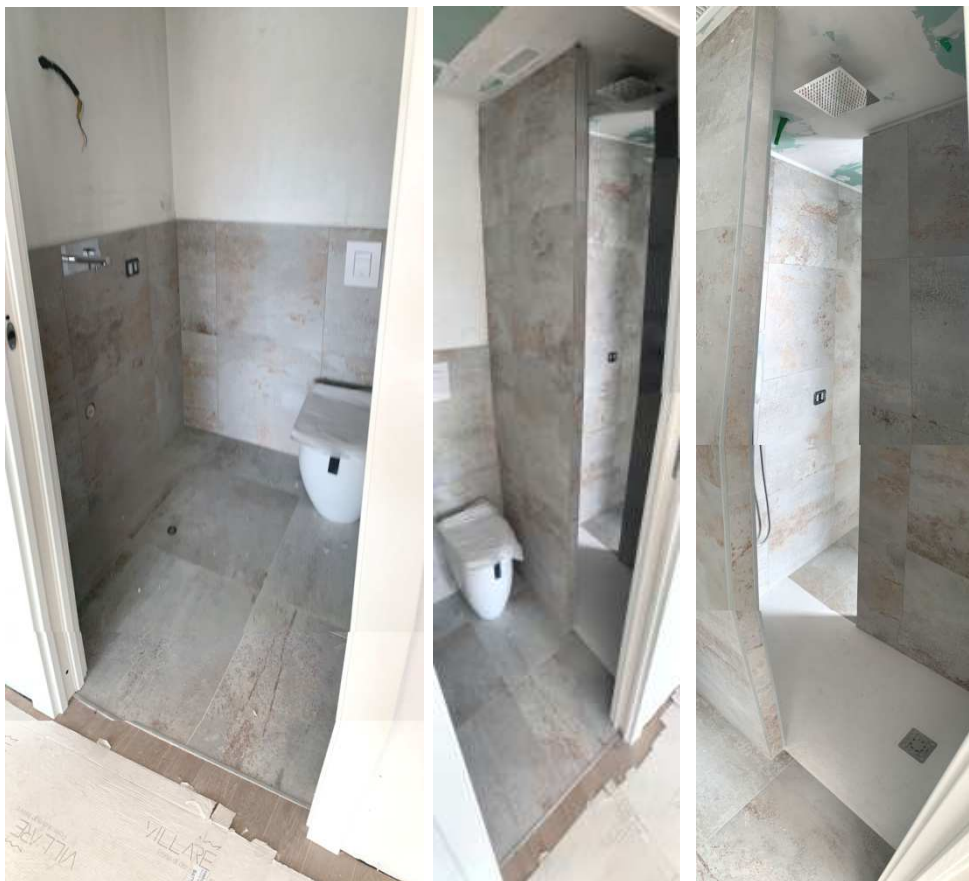
Foto nn. 21-22-23. Piano Terzo. Bagno pag. 7