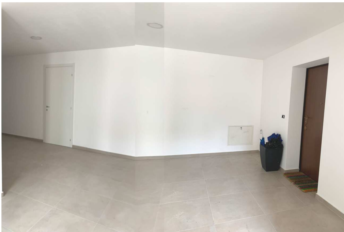
Foto nn. 14-15-16. Ingresso condominiale e androne comune