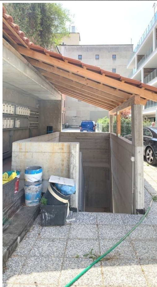
Foto nn. 11-12. Ingresso pedonale da Via Montevideo e scala esterna comune di collegamento ai piani interrati