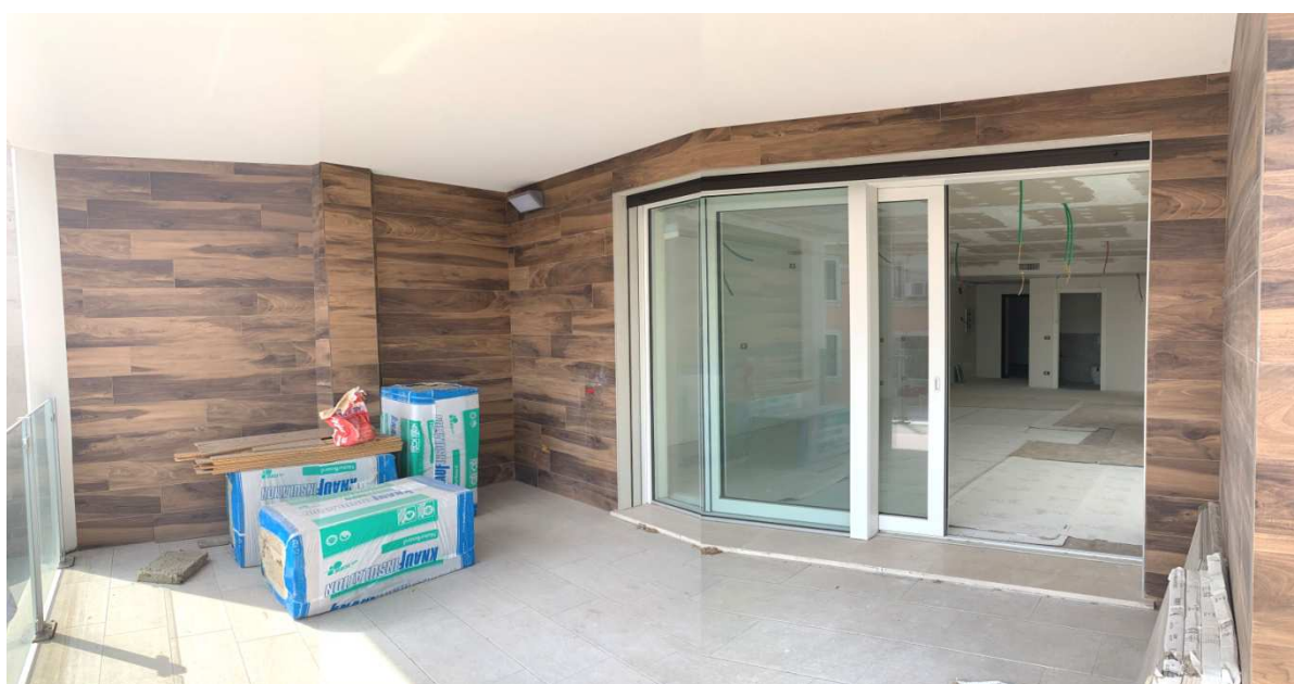
Foto n. 29. Piano Terzo. Balcone