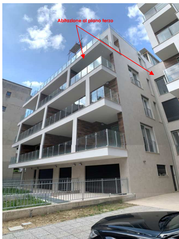
Foto nn. 8-9-10. Palazzina condominiale pag. 3