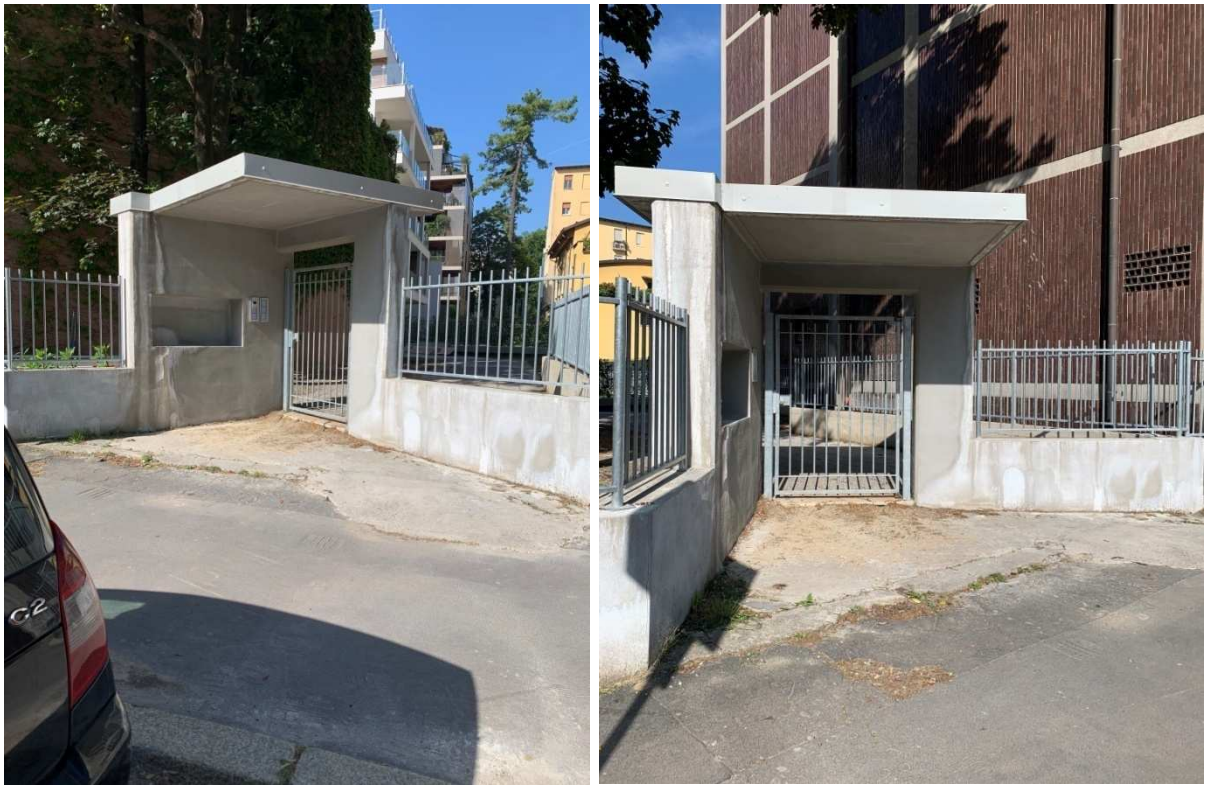
Foto nn. 4-5. Ingresso condominiale pedonale da Via Montevideo n. 11, in fase di completamento