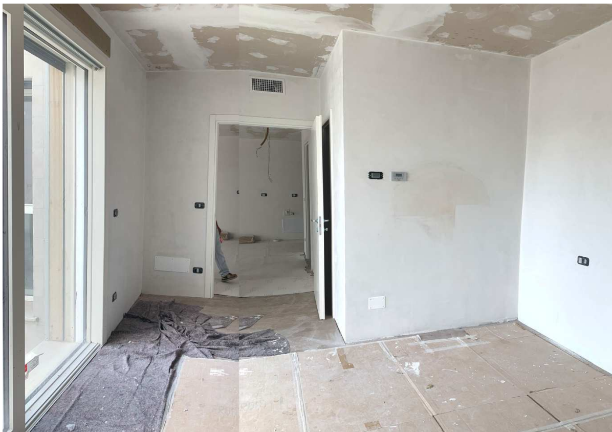
Foto nn. 24-25. Piano Terzo. Letto