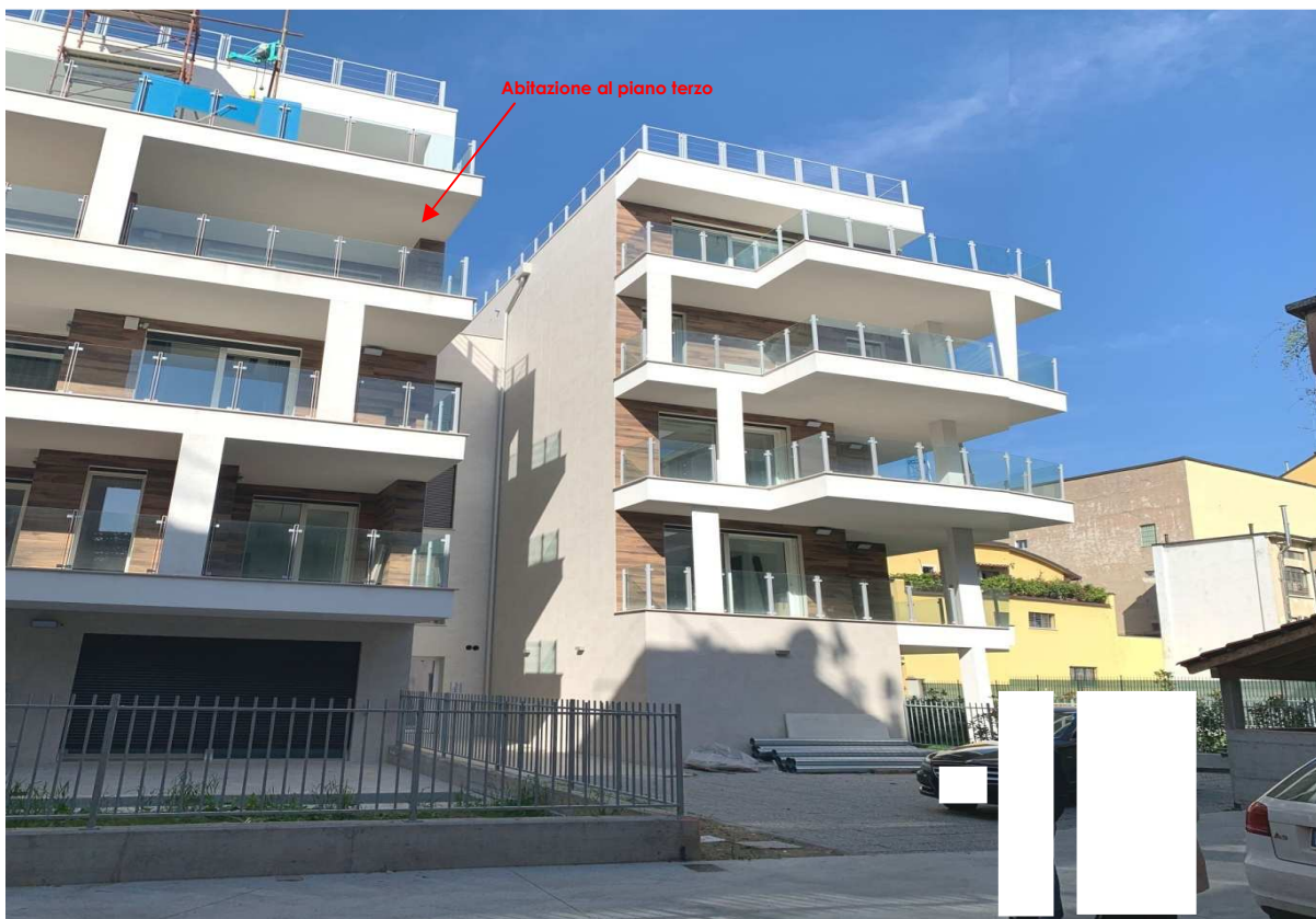
Foto n. 13. Palazzina condominiale