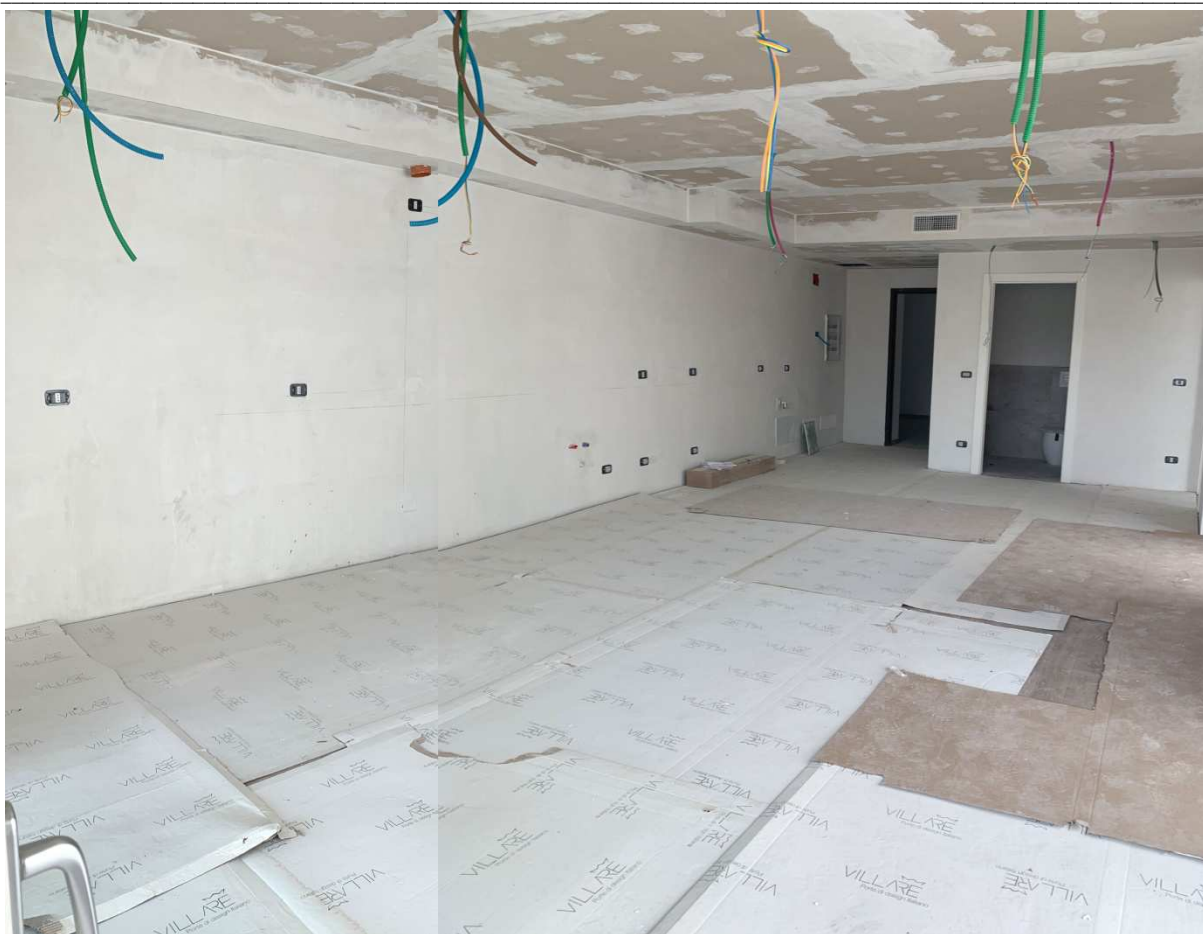
Foto n. 20. Piano Terzo. Soggiorno/cucina