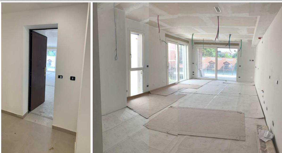
Foto nn. 17-18. Piano Terzo. Ingresso abitazione e soggiorno/cucina