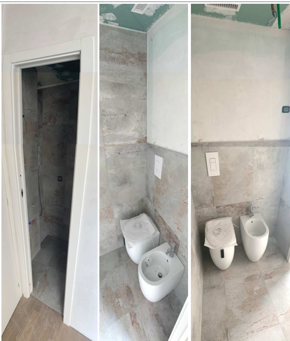
Foto nn. 26-27-28. Piano Terzo. Bagno