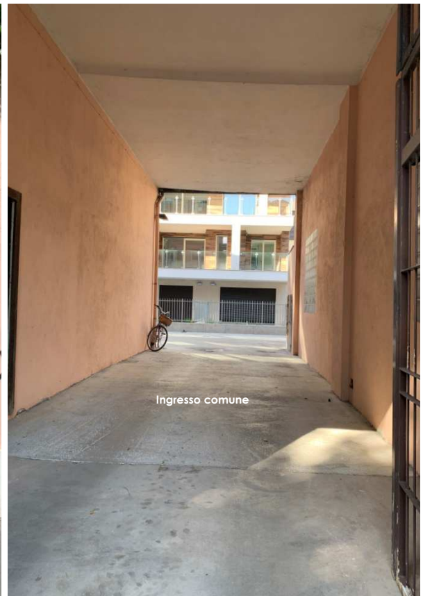
Foto nn. 1-2-3. Appartamento per civile abitazione al piano terzo, identificato al Catasto Fabbricati al foglio n. 471 ptc. n. 413 sub . n. 18, sito nel Comune di Milano (MI), zona Solari, alla Via Montevideo n. 11. Ingresso condominiale carroia e pedonale