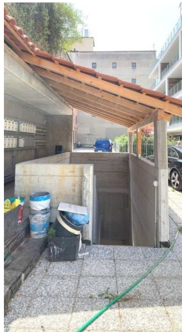
Foto nn. 4-5-6-7. Box auto al piano S1, facente parte integrante della palazzina condominiale denominata "Residenze Parco Solari". Cortile condominiale, accesso carrabile comune ai piani interrati e scala esterna (scala B) di collegamento ai piani S1-S2