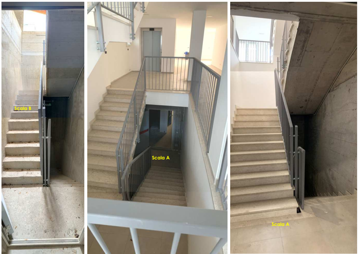
Foto nn. 8-9-10. Scale comuni (scale A e B) di collegamento ai piani interrati