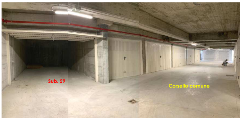
Foto nn. 11-12. Piano Primo Interrato. Box auto (fg. n. 471 pct. n. 413 sub. n. 59)