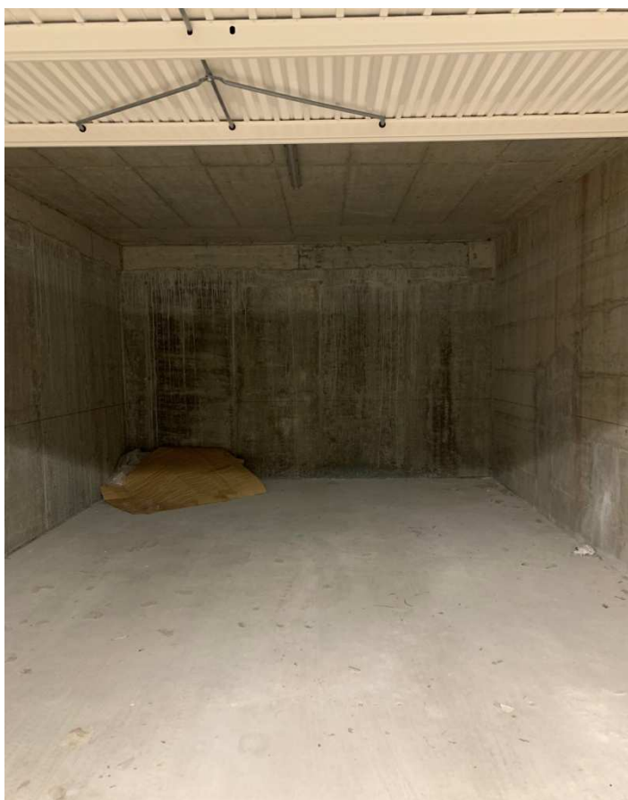
Foto nn. 13-14. Piano Primo Interrato. Box auto