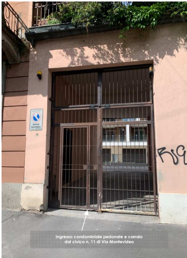
Ingresso condominiale pedonale e carroia dal civico n. 11 di Via Montevideo