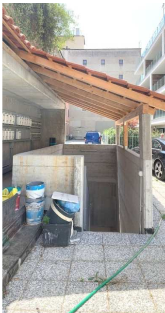
Foto nn. 4-5-6-7. Box auto al piano S1, facente parte integrante della palazzina condominiale denominata "Residenze Parco Solari". Cortile condominiale, accesso carrabile comune ai piani interrati e scala esterna (scala B) di collegamento ai piani S1-S2