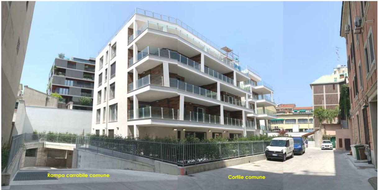
Rampa carrabile comune